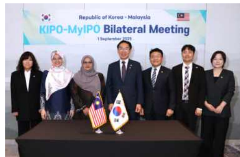
김완기 특허청장(왼쪽 4번째)과 유스니에자 샬라 유소프(Yusnieza Syarmila Yusoff) 말레이시아 지식재산청장(왼쪽 3번째) 및 관계자들이 기념촬영을 하고 있다.