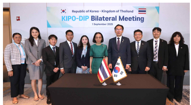
김완기 특허청장(왼쪽 7번째)과 누사라 칸자나쿨(Nusara Kanjanakul) 태국 지식재산청장(왼쪽 6번째) 및 관계자들이 기념촬영을 하고 있다.