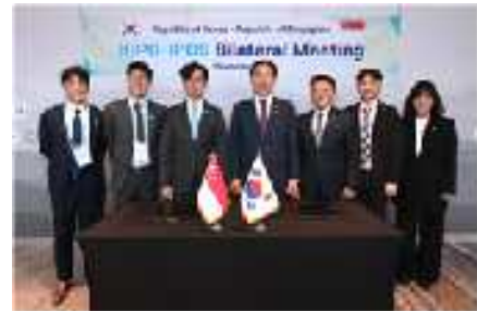
김완기 특허청장(왼쪽 4번째)이 탄 콩 휘(Tan Kong Hwee) 싱가포르 지식재산청장(왼쪽 3번째) 및 관계자들과 기념촬영을 하고 있다.