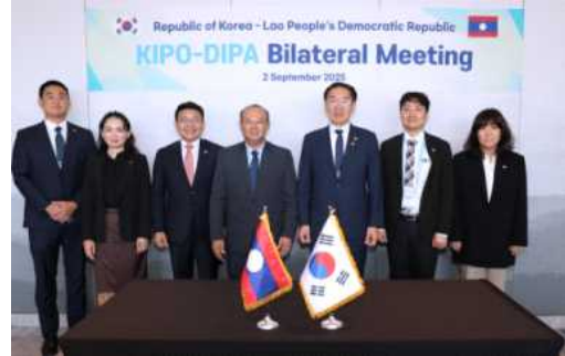
김완기 특허청장(왼쪽 5번째)이 자이솜펫 노라싱(Xaysomphet Norasing) 라오스 지식재산청장(왼쪽 4번째) 및 관계자들과 기념촬영을 하고 있다.