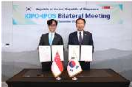
김완기 특허청장(오른쪽)과 탄 콩 휘(Tan Kong Hwee) 싱가포르 지식재산청장이 MOU 서명 후 기념촬영을 하고 있다.

김완기 특허청장과 탄 콩 휘(Tan Kong Hwee) 싱가포르 지식재산청장이 9. 1.(월) 10시 40분, 호텔 나루 서울 엠갤러리(서울 마포구)에서 양해각서(MOU)를 체결했다. 이 날 서명한 MOU에는 AI, IP 금융, 가치평가, 보호, 최첨단 기술 관련 협력 내용을 포함하고 있다.