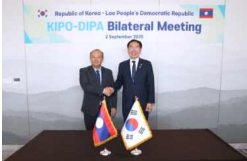
김완기 특허청장(오른쪽)과 자이솜펫 노라싱(Xaysomphet Norasing) 라오스 지식재산청장이 기념촬영을 하고 있다.

김완기 특허청장과 자이솜펫 노라싱(Xaysomphet Norasing) 라오스 지식재산청장이 9. 2.(화) 14시, 호텔 나루 서울 엠갤러리(서울 마포구)에서 청장 회담을 진행했다. 이날, 세계지식재산기구 한국 신탁기금을 통한 브랜드 지원사업과 지식재산 교육 협력, IP 금융 및 스타트업 지원 정책에 대해 논의했다.