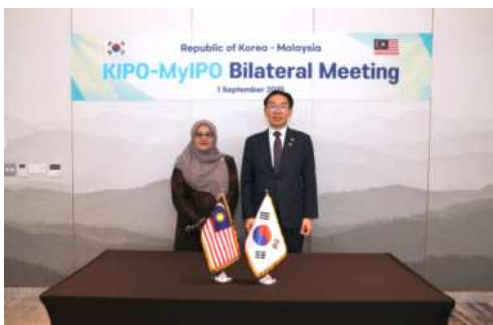
김완기 특허청장(오른쪽)과 유스니에자 샬라 유소프(Yusnieza Syarmila Yusoff) 말레이시아 지식재산청장이 기념촬영을 하고 있다.

김완기 특허청장과 유스니에자 샬라 유소프(Yusnieza Syarmila Yusoff) 말레이시아 지식재산청장은 9. 1.(월) 11시 30분, 호텔 나루 서울 엠갤러리(서울 마포구)에서 청장회담을 진행했다. 이날, 중소기업 지원정책, IP 분야 AI 활용 및 IP 보호 협력에 대한 내용을 논의했다.