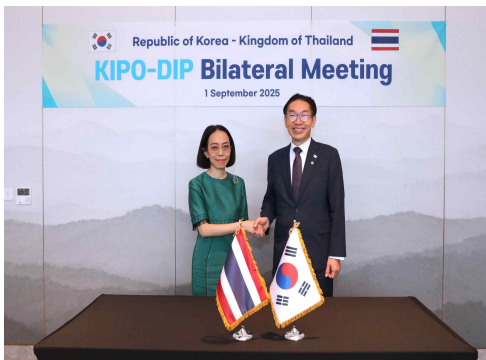
김완기 특허청장(오른쪽)과 누사라 칸자나쿨(Nusara Kanjanakul) 태국 지식재산청장이 기념촬영을 하고 있다.

김완기 특허청장과 누사라 칸자나쿨(Nusara Kanjanakul) 태국 지식재산청장이 9.1.(월) 10시, 호텔 나루 서울 엠갤러리(서울 마포구)에서 청장회담을 진행했다. 이날, 양 청간 포괄협력 MOU 체결에 합의하고, 지식재산 보호 협력을 논의했다.