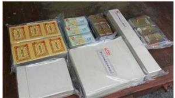
현장 압수물(가짜 포장지)