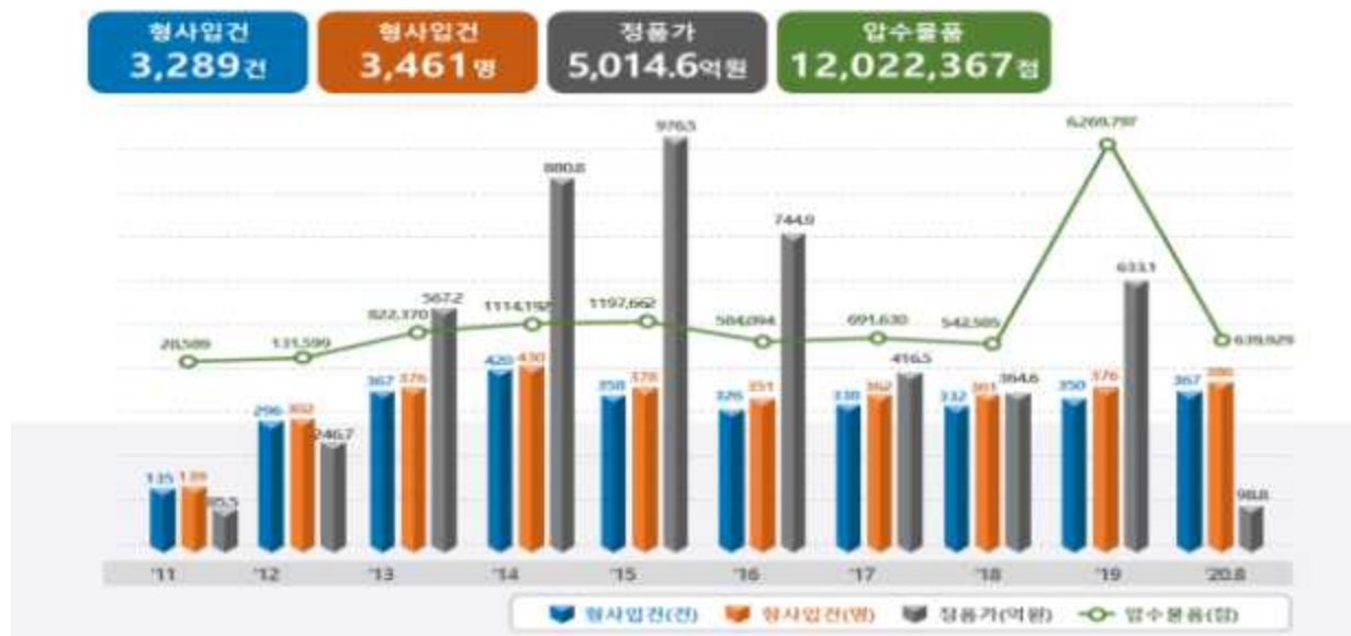
<특허청 특별사법경찰 단속실적('11~'20.8)>

□ 특허청(청장 김용래) 산업재산 특별사법경찰(이하 특사경)이 올해로 출범 10년을 맞았다.