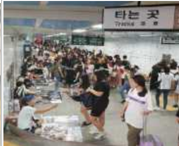
(단속이전, '18년) 공연장 주변