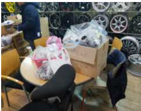
위조 자동차 휠 판매장소