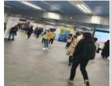
(단속이후, '19년) 공연장 주변